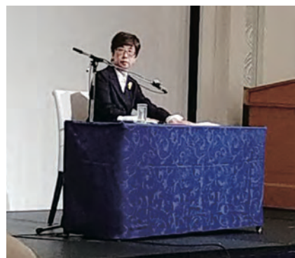
▲ 議長を務められた齊藤副会長