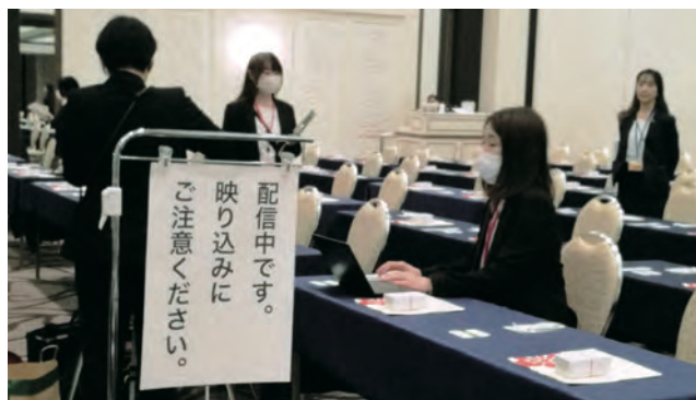
▲ オンライン配信ブース