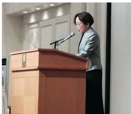
▲ 小笠原同窓会長のご挨拶